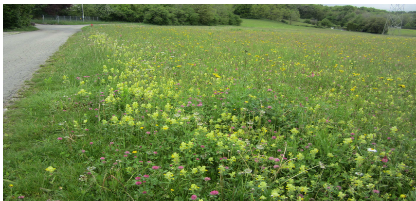
Prairie fleurie le long de la route des Montagnards favorable à la flore mais aussi à la faune.