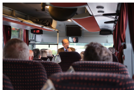
Début de la séance dans le car !

A l'initiative de son Président, le Conseil général de Vich a eu la chance de pouvoir siéger dans la salle du Grand Conseil à Lausanne.