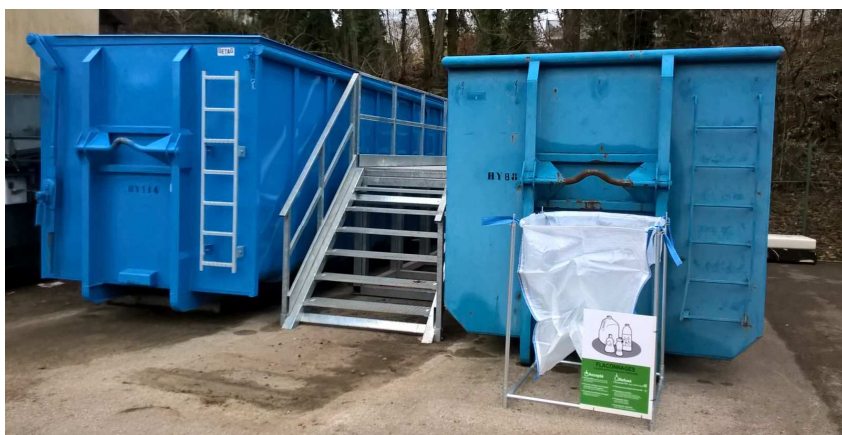
Benne pour la collecte du bois, rampe d'accès et recyclage des plastiques de flaconnage.

Collecte du bois Une nouvelle benne a fait son apparition au centre de tri pour la récupération du bois : déchets encombrants majoritairement en bois, planches et panneaux en bois, palettes y seront collectés pour être recyclés en combustibles de chauffage industriels.