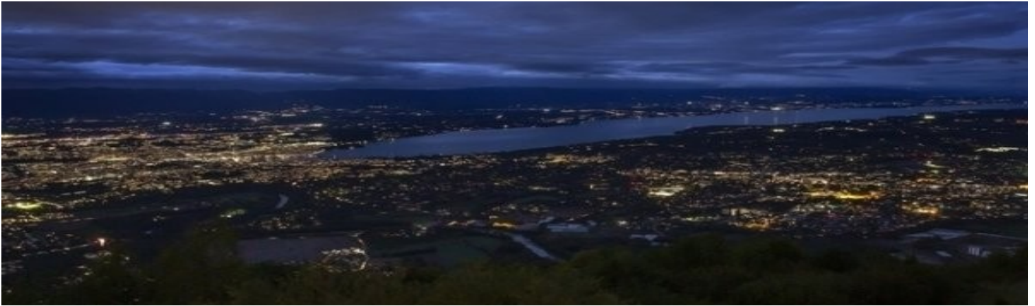
La baie de Genève en partie éteinte

Curieux, nous avons souhaité recueillir l'avis de nos concitoyens sur la page Facebook de Vich, avec le sondage suivant: "Avez-vous aimé éteindre l'éclairage public la nuit ? L'avantage écologique pour l'un est-il supérieur à l'inconvénient d'avoir des rues sombres pour l'autre?".