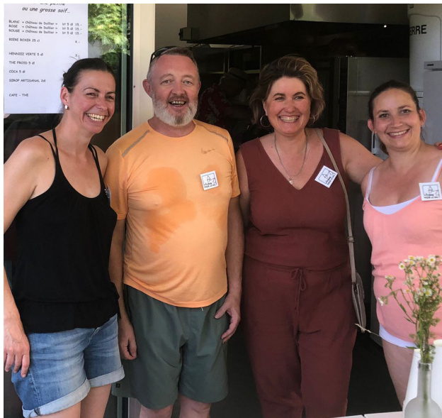
Le comité de l'association.

N'hésitez pas à regarder sur le page de Vich en fête sur Facebook pour les prochaines manifestations et à contacter l'équipe à vichenfete@gmail.com si vous avez des idées pour une prochaine fête, ou pour donner un coup de main.