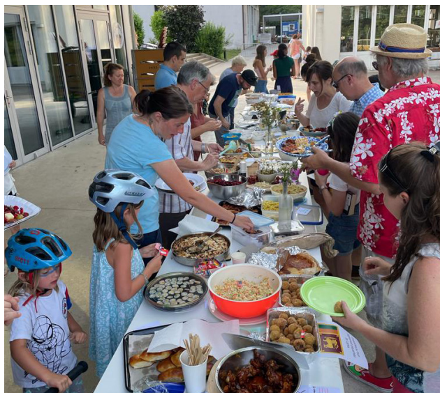
Un buffet international de haute qualité.

été les frimousses d'enfants non maquillées en fin de journée! Les scouts ont aussi été très contents d'avoir pu compléter leur cagnote avec presque 100 CHF pour financer leur voyage pour le Jamboree en Corée du Sud.